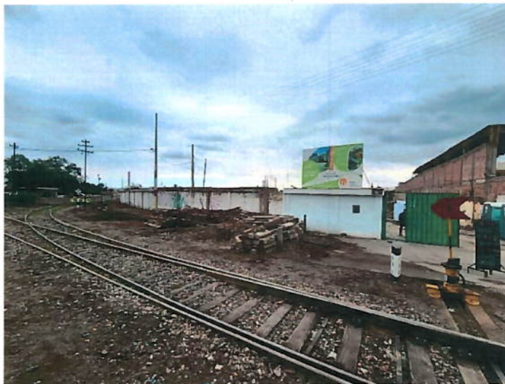
Figura N°05 – Delimitación de área concesionada con material de tercera (durmientes bi-block).