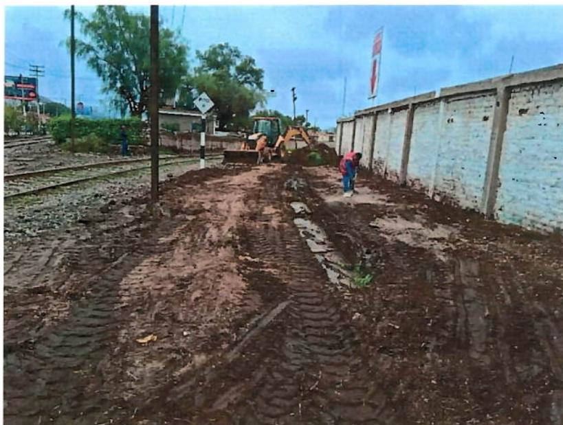
Fotografía N°01 – Trabajos de movimiento de tierras no autorizados dentro de área concesionada entre el km 0.000 y el kilómetro 0.100 de la subdivisión 4 (Estación Tres Cruces).