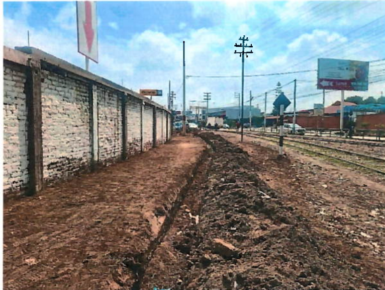
Fotografía N°02 – Trabajos de movimiento de tierras no autorizados dentro de área concesionada entre el km 0.000 y el kilómetro 0.100 de la subdivisión 4 (Estación Tres Cruces).