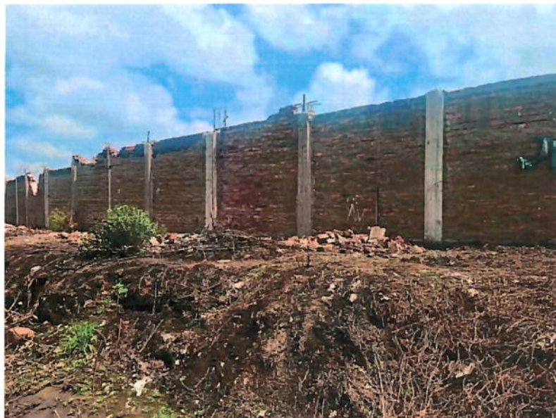
Fotografía N°03 – Trabajos no autorizados dentro de área concesionada, escombros entre el km 0.000 y el kilómetro 0.100 de la subdivisión 4 (Estación Tres Cruces).