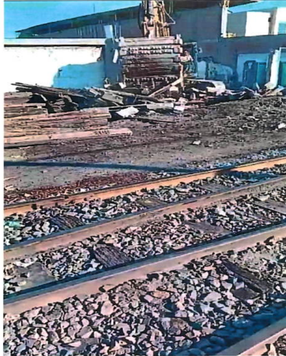
Figura N° 06 – Se evidencia el uso de maquinaria para retirar el material reutilizado (durmientes bi-block) colocado por FTSA con el fin de proteger el área concesionada.

En consecuencia, rechazamos y controvertimos las afirmaciones contenidas en las anteriores comunicaciones notariales dirigidas a mi representada, así como las vertidas en el presente reclamo. Afirmamos que, por nuestra parte, hemos actuado en todo momento con respeto e integridad, informándole oportunamente la denegatoria del permiso solicitado.