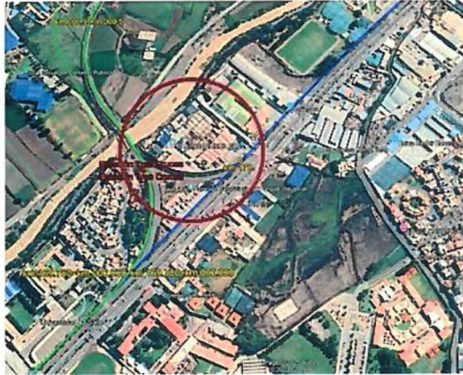
Fotografía N°07 – Vista satelital de la progresiva 3.170 de la subdivisión 4. Zona de intervención de trabajos de la Municipalidad de Arequipa.