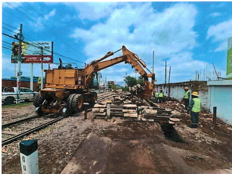
Figura N°04 – Delimitación de área concesionada con material de tercera (durmientes bi-block reutilizados).